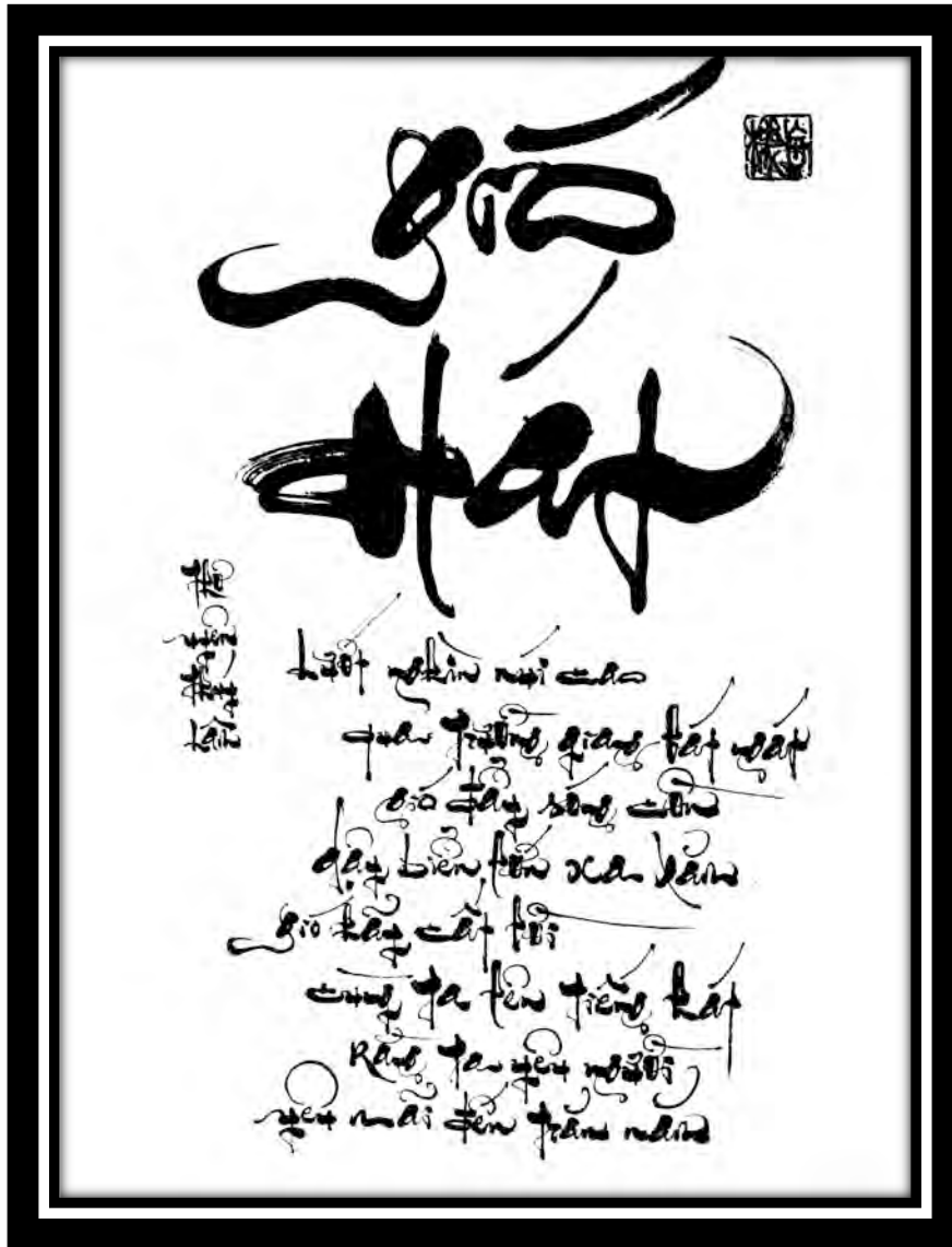
Thư pháp: Phi Bảo